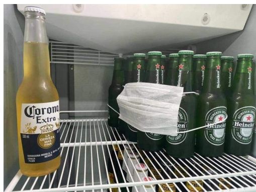
Le frigo du club house

et n'oubliez pas Ponce Pilate, lavez vous les mains.