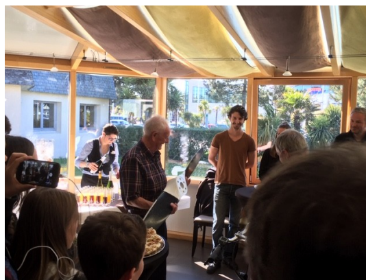
La réponse de Jean