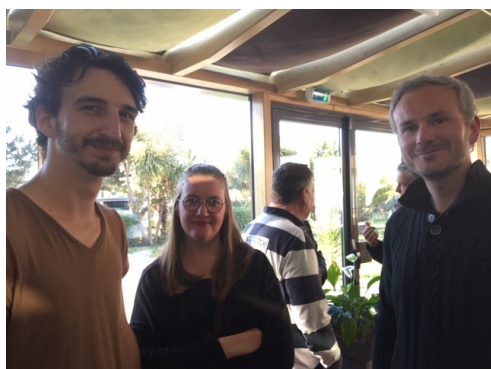
Des pilotes jeunes