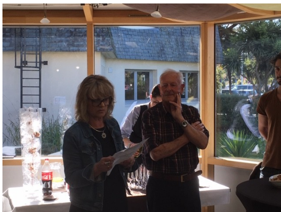
Le discours de la présidente