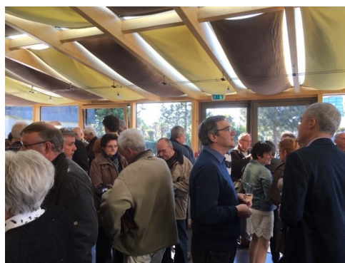
et moins jeunes